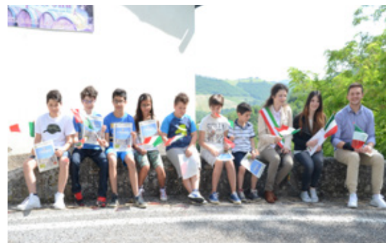
Consegna della Costituzione

le a queste iniziative, così come nel ricordare il 25 aprile e il 4 novembre, ha organizzato il 2 giugno una breve cerimonia con tutti i giovani del Comune che hanno raggiunto o raggiungono, nel corso del 2015, la maggiore età, per consegnare a ciascuno di loro una copia della Costituzione della Repubblica Italiana, dando risalto alla nuova condizione di cittadino che essi assumono con il raggiungimento della maggiore età.