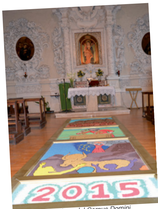
Processione del Corpus Domini a Serrapetrona