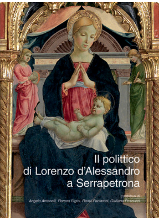
Il politico di Lorenzo d'Alessandro a Serrapetrona