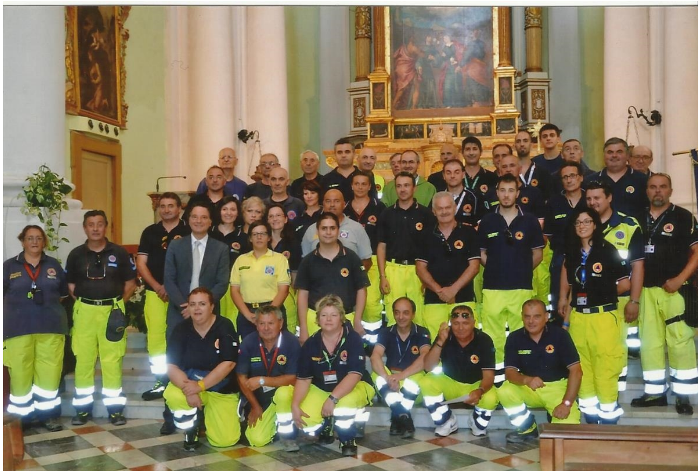
insieme agli amici volontari del gruppo Comunale di Mogliano

Ma i volontari hanno prestato la loro opera di volontariato anche all'ambiente: infatti a maggio si è tenuta la 2° edizione di "Puliamo i 5 Comuni", iniziativa organizzata dagli assessorati all'ambiente dei Comuni di Serrapetrona, Camporotondo di Fiastone, Cessapalombo, Caldarola e Belforte del Chienti, in collaborazione proprio con i Gruppi comunali di volontariato di Protezione Civile, con il COSMARI, altre associazioni di volontariato e semplici cittadini. Una giornata dedicata alla raccolta di rifiuti abbandonati, che sono stati depositati presso l'isola ecologica di Camporotondo, e al censimento di rifiuti abbandonati presenti in alcune zone dei nostri territori, 1500 chilogrammi di rifiuti sono stati raccolti, bonificando diversi siti: tale input da parte del volontariato lancia un appello importantissimo al senso civico della popolazione per la salvaguardia e la tutela dell'ambiente.