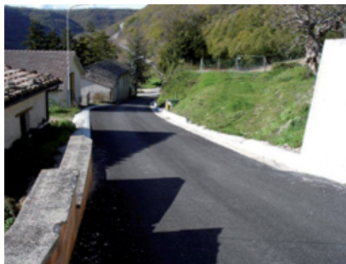
a lavori ultimati