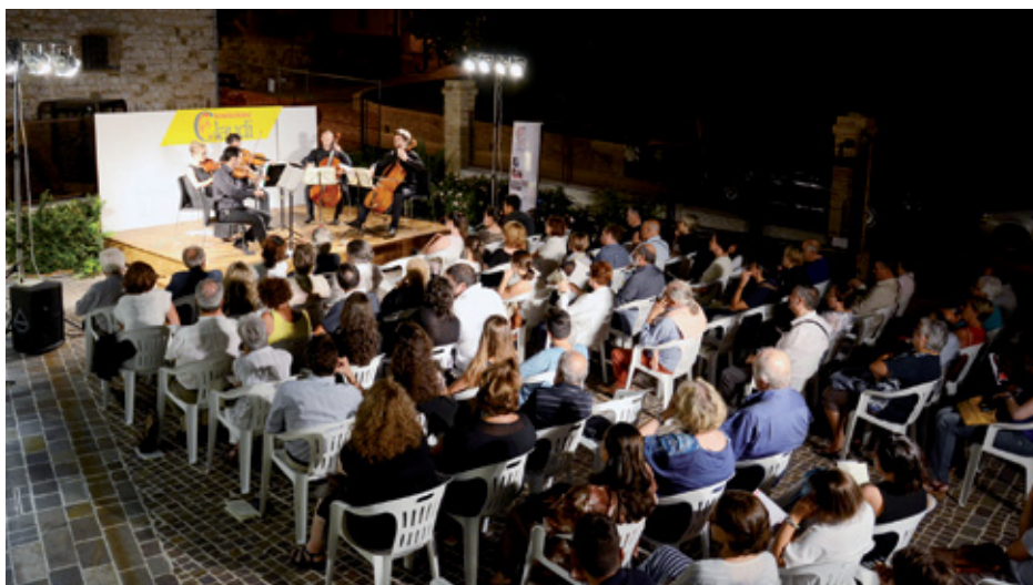
Concerti a Palazzo Claudii

Il tutto davanti ad una numerosa e soddisfatta cornice di pubblico. Del resto questo festival già