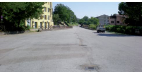
prima dei lavori