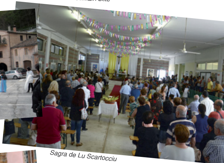
Sagra de Lu Scartocciu