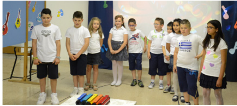
Recita di fine anno scolastico, alunni scuola elementare.