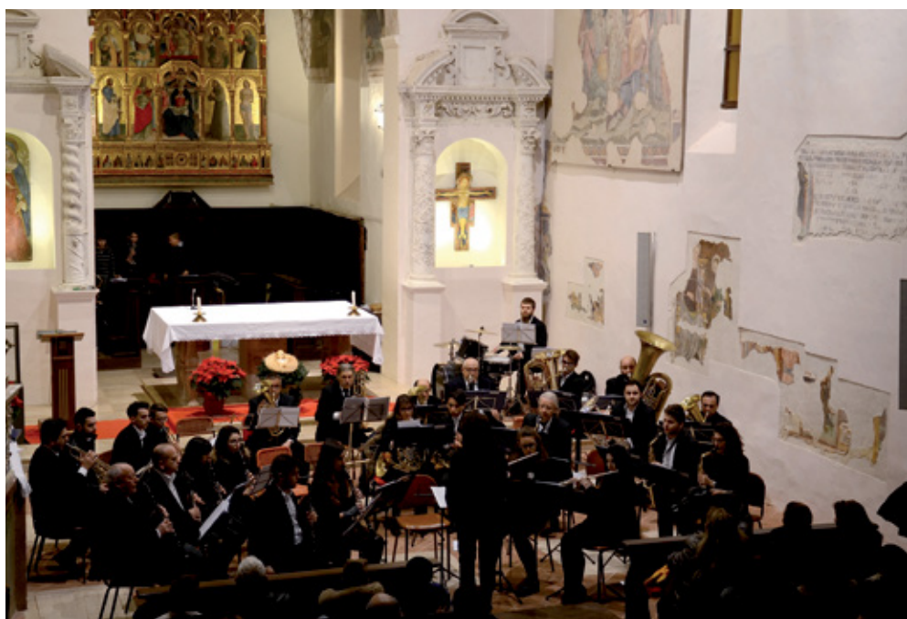
Concerto banda cittadina

Inoltre, è sempre presente in occasione delle feste civili e istituzionali: il 25 aprile Festa della Liberazione al monumento ai caduti di Caccamo; il 1 novembre nel ricordo dei caduti. A dicembre si svolge, come ormai consuetudine, il tradizionale concerto di Natale nella chiesa di San Francesco: nell'appuntamento dello scorso anno anche i bambini del corso di orientamento musicale si sono cimentati per la prima volta nell'esecu-