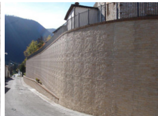
a lavori ultimati