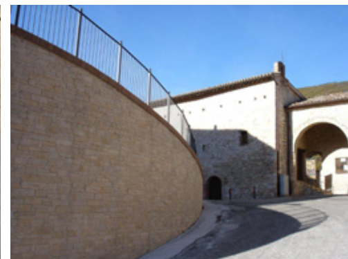
a lavori ultimati