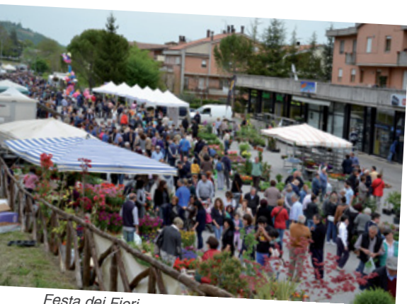
Festa dei Fiori