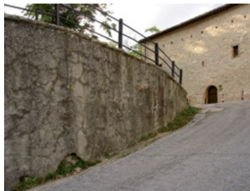
prima dei lavori