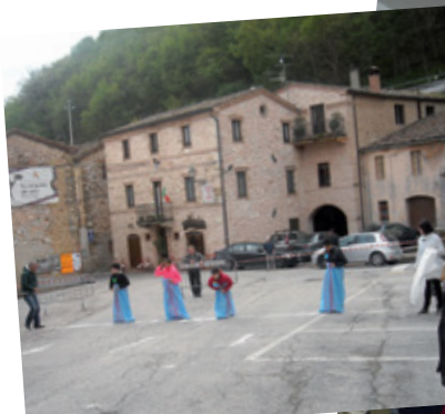
Tradizionali giochi di Pasquetta