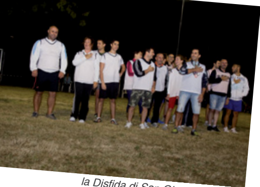
la Disfida di San Giacomo, Caccamo squadra vincitrice