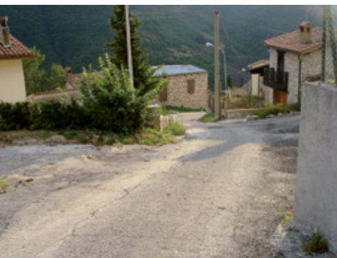
prima dei lavori