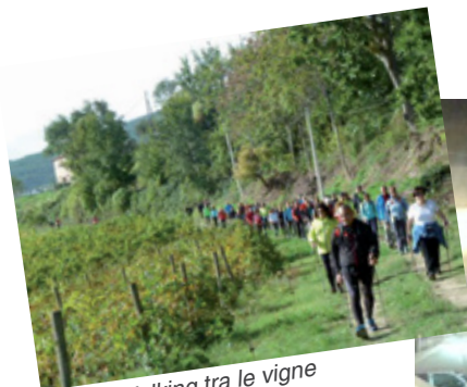
Nordic Walking tra le vigne a Serrapetrona