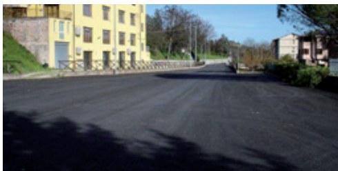
a lavori ultimati

Mentre a Serrapetrona sono ancora in corso e a buon punto diversi lavori, prevediamo di ultimarli a primavera con la realizzazione degli asfalti.