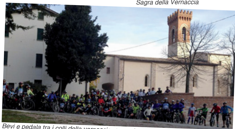
Bevi e pedala tra i colli della vernaccia, escursioni in mountain bike