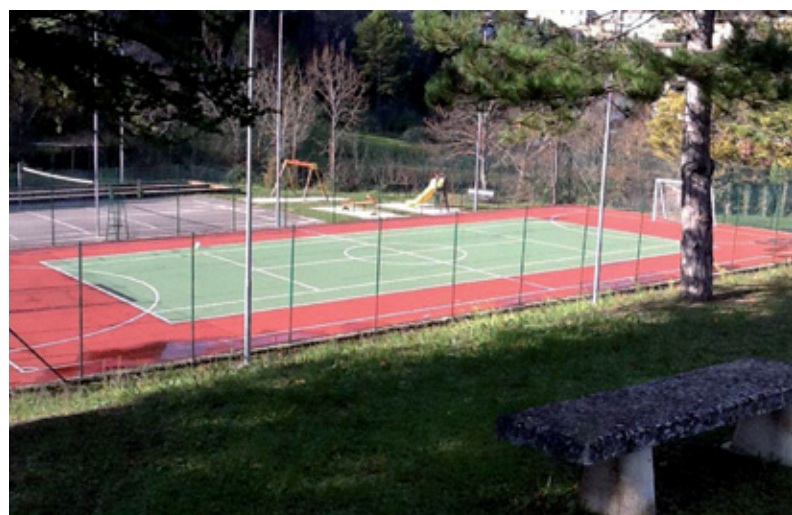
Serrapetrona impianti sportivi e parco giochi