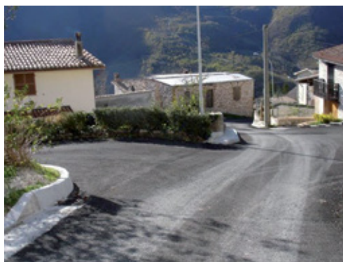
a lavori ultimati