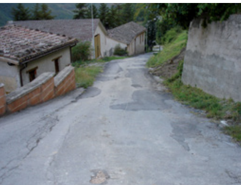
prima dei lavori