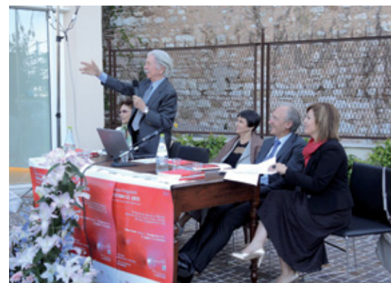
Vernissage della mostra

avuto l'opportunità di lavorare a cortometraggi sull'artigianato che scompare, oggi importante testimonianza di un territorio che cambia.