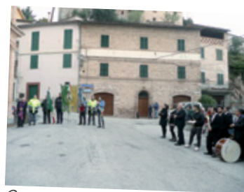
Commemorazione ai Caduti

Comune di Serrapetrona - via Giacomo Leopardi, 18 - 62020