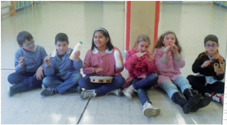
Gli alunni durante le prove dello spettacolo natalizio

Serrapetrona 5 Dicembre 2015 Novena... Novena che a Natale su ogni cosa si passasse la corvata della pace. Novena che a Natale ci fosse un regalo per tutti i bambini del mondo. Novena che ci fosse la casa più bella ad ogni persona del mondo. Novena aiutare al meglio chi ha bisogno. Novena un angelo custode per ciascun uomo. Novena la pace per tutti i bambini. Novena che la neve sparsesse ghiande di fiori. Novena di amicizia fra tutti i popoli.