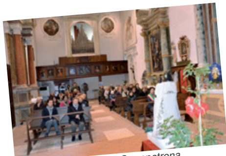
Madonna Lauretana a Serrapetrona