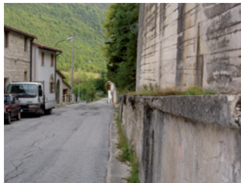
prima dei lavori

Muri di sostegno e rifacimento pavimentazioni stradali.