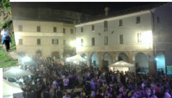
Sagra della Vernaccia