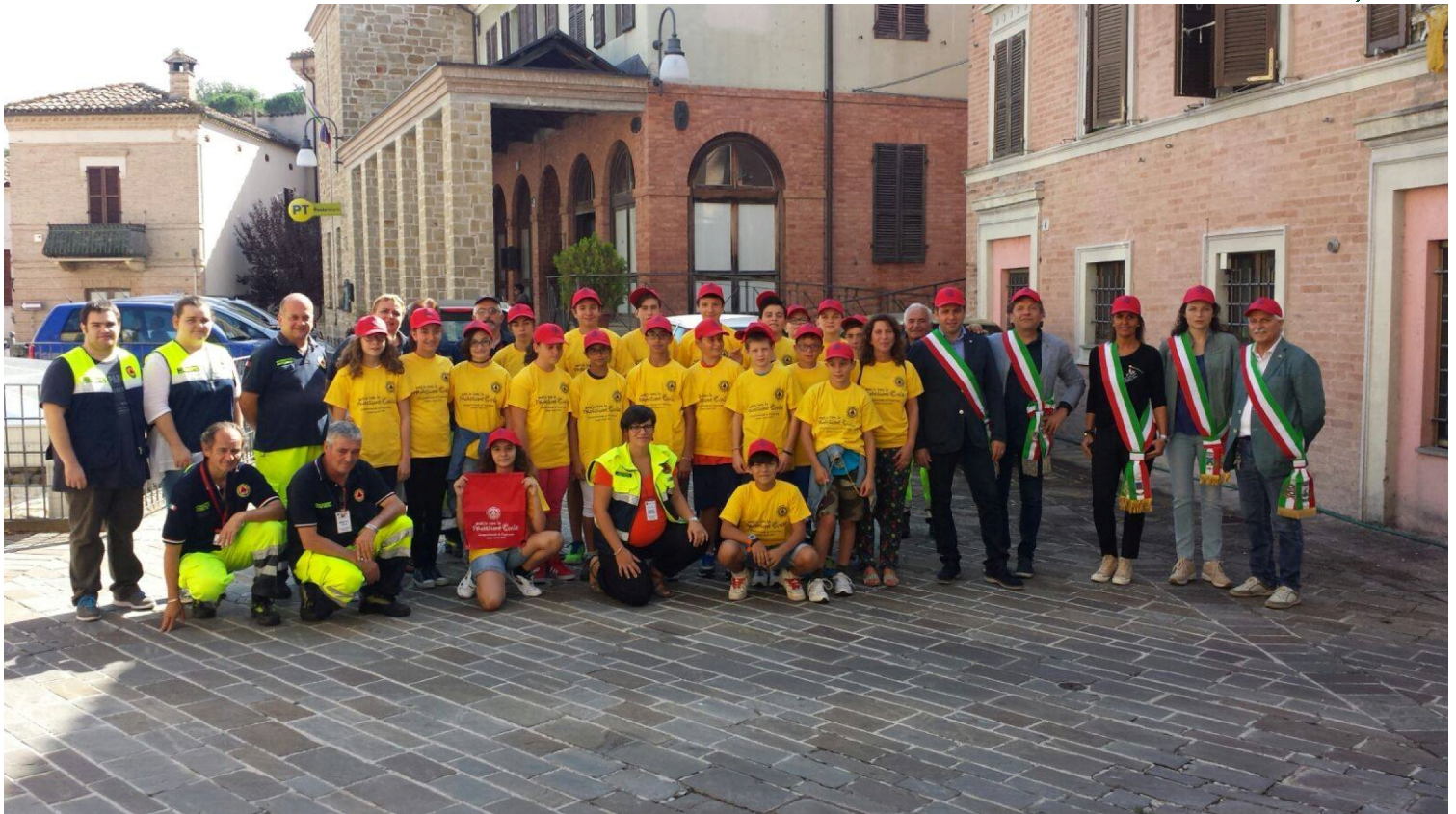
primo campo scuola della Protezione Civile dei 5 Comuni