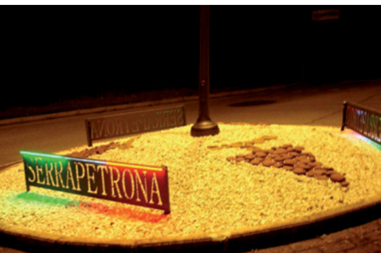
Serrapetrona aiuola centrale